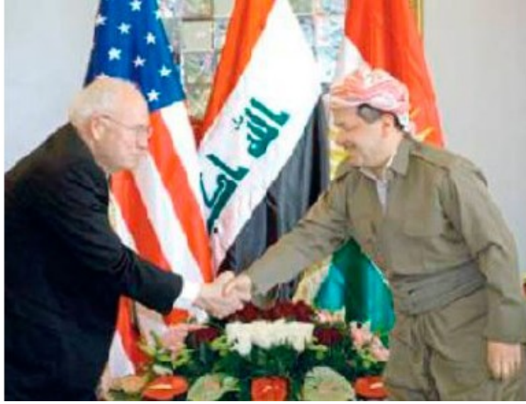
استقبال حار بطل العلم المزيف